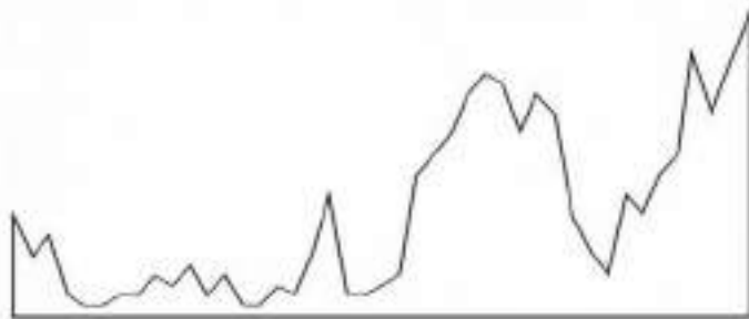
Diagram Struktur Dramatik 'Apa Jang Kau Tjari, Palupi?'

Aristoteles (384 SM-322 SM) serta para Formalis dan Strukturalis seperti Vladimir Propp (1895-1970) yang menyatakan bahwa karakter adalah produk dari plot, berstatus fungsional, dan harus menghindari esensi psikologi serta tidak melihat karakter sebagai manusia melainkan hanya dari apa yang mereka lakukan dalam plot, 1 telah dipatahkan oleh Strukturalis lain seperti Tzvetan Todorov (1939- ) dan Roland Barthes (1915-1980). Terutama Todorov, ia membedakan naratif dalam hubungannya dengan karakter dan plot menjadi dua; plot-centered atau apsychological dan character-centered atau psychological narratives . 2